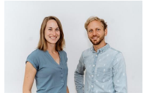
Team 2nd Chance Cereals

2nd chance cereal produces crunchy and unique breakfast granola. Unsold bread baked in the morning is roasted and further refined with spices, nuts and berries. This saves not only bread and water, but also creates a unique taste experience, delicious crunchy, vegan granola with less sugar added .