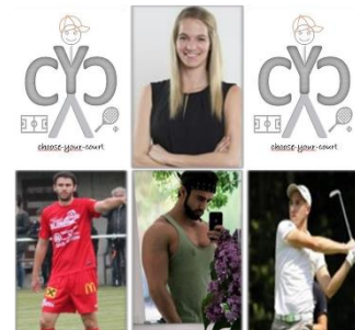
Team Choose your Court

Oft steht man im Sport vor der Herausforderung ein Team oder einen Partner zu finden. Unsere Vision ist es, Betreiber von Sportstätten und Sporttreibende auf einer Plattform unkompliziert zusammen zu bringen. Rund um die Uhr buchen, gleichzeitig einen oder mehrere Trainingspartner finden – CYC ist die Lösung: FIND→BOOK→PAY→PLAY